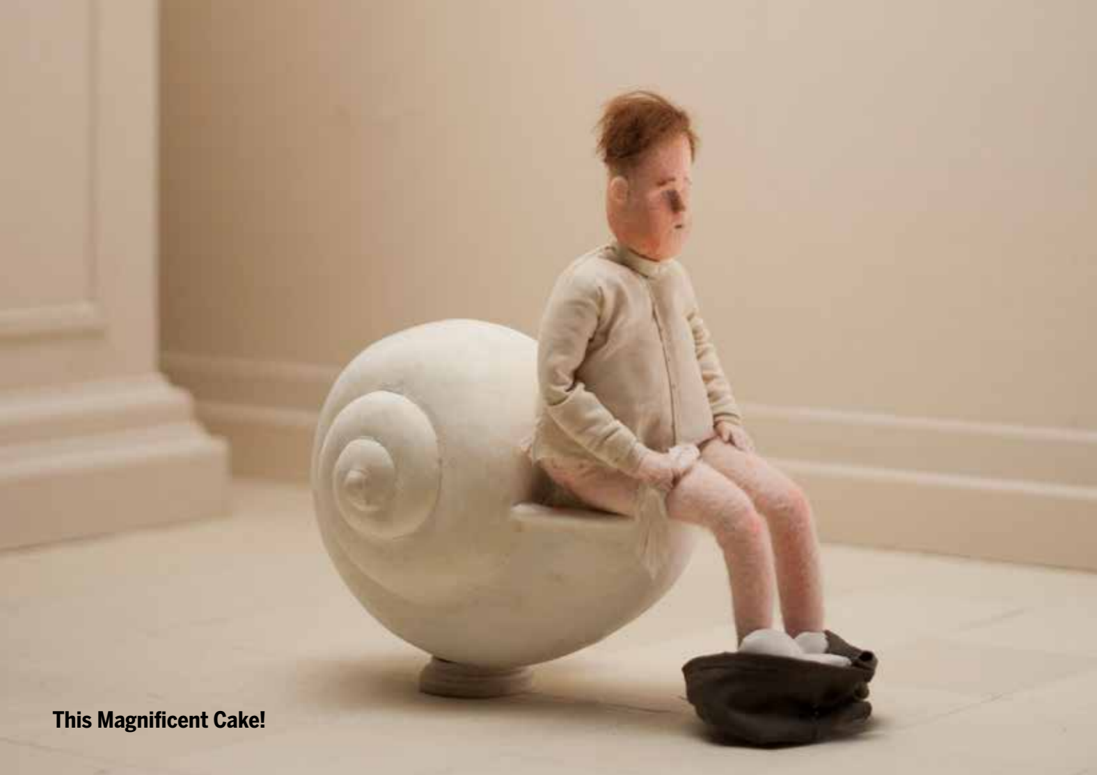
This Magnificent Cake!