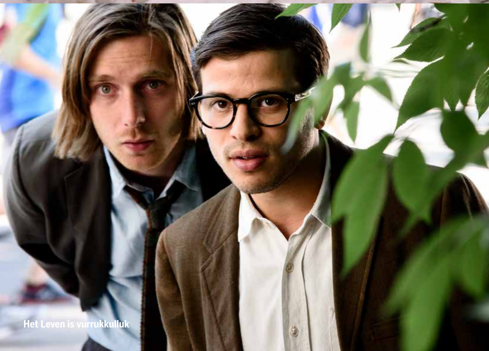
Het Leven is vurrukkulluk