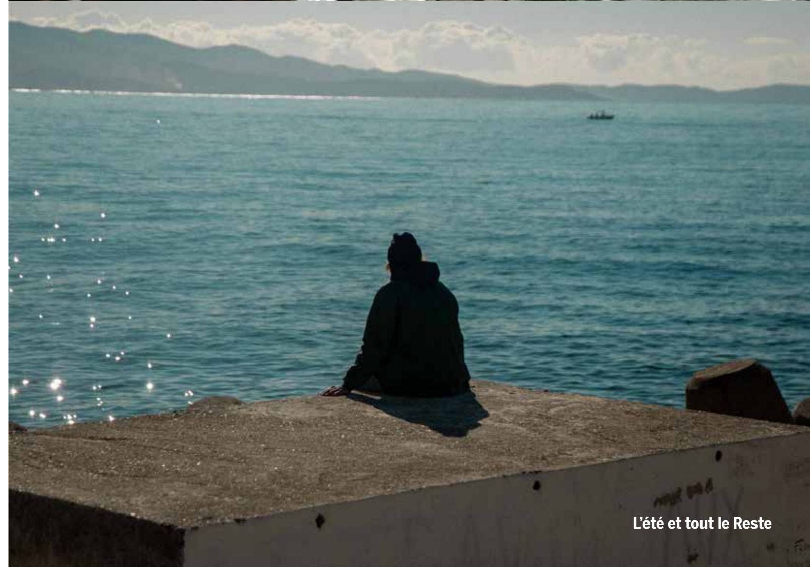
L'été et tout le Reste