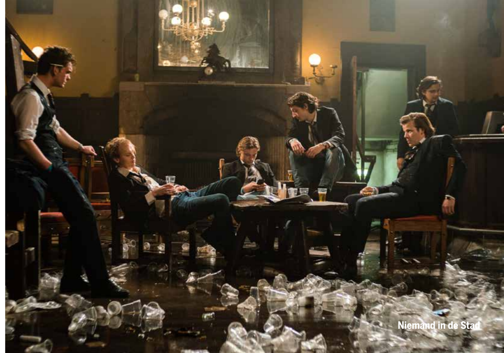
Niemand in de Stad