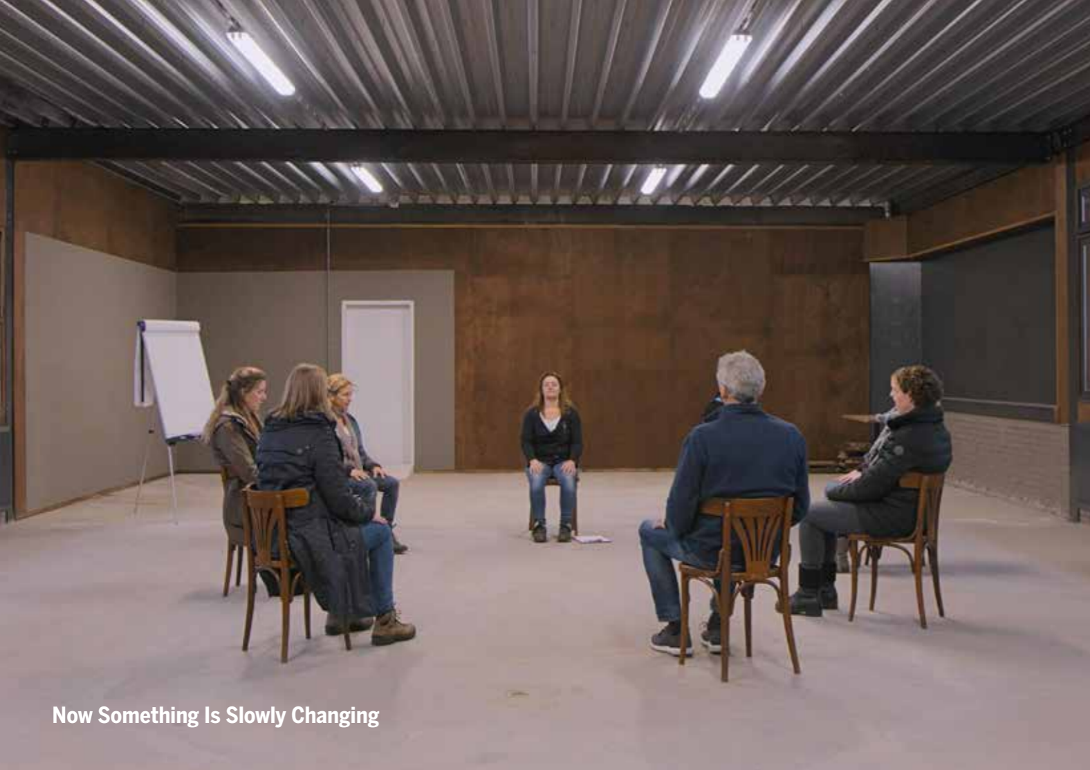
Now Something Is Slowly Changing