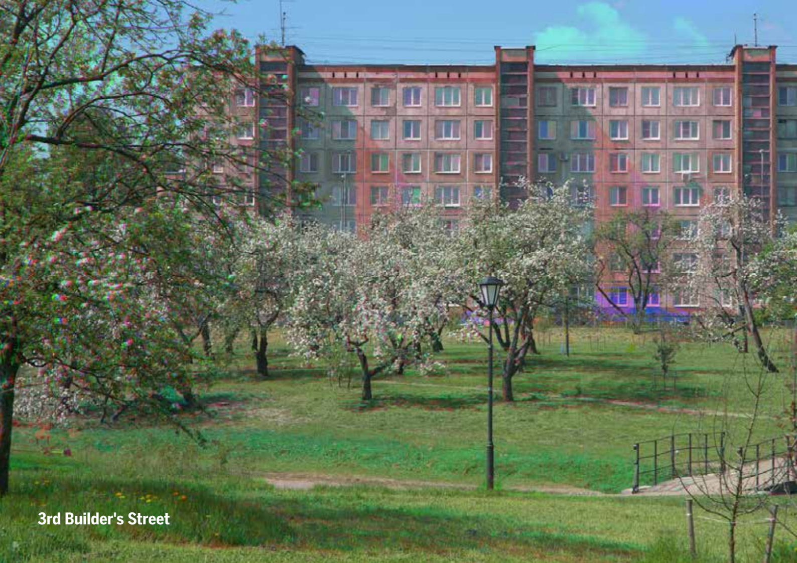
3rd Builder's Street