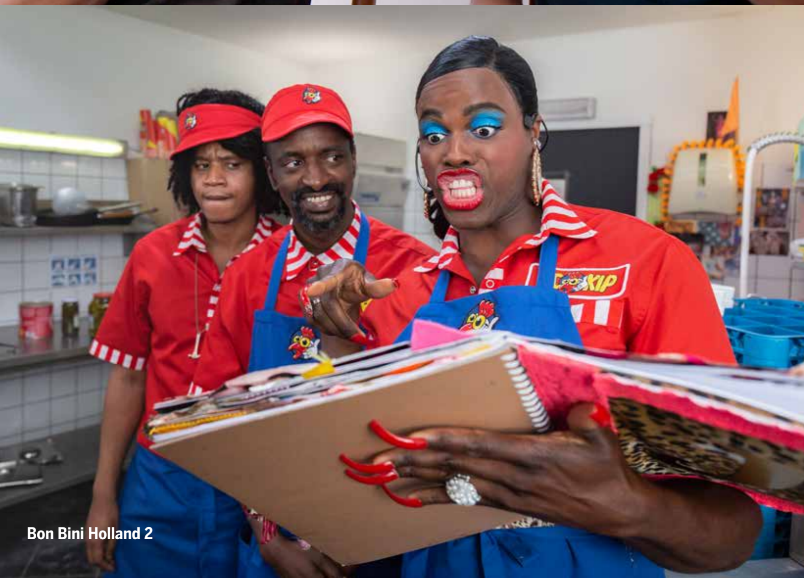
Bon Bini Holland 2