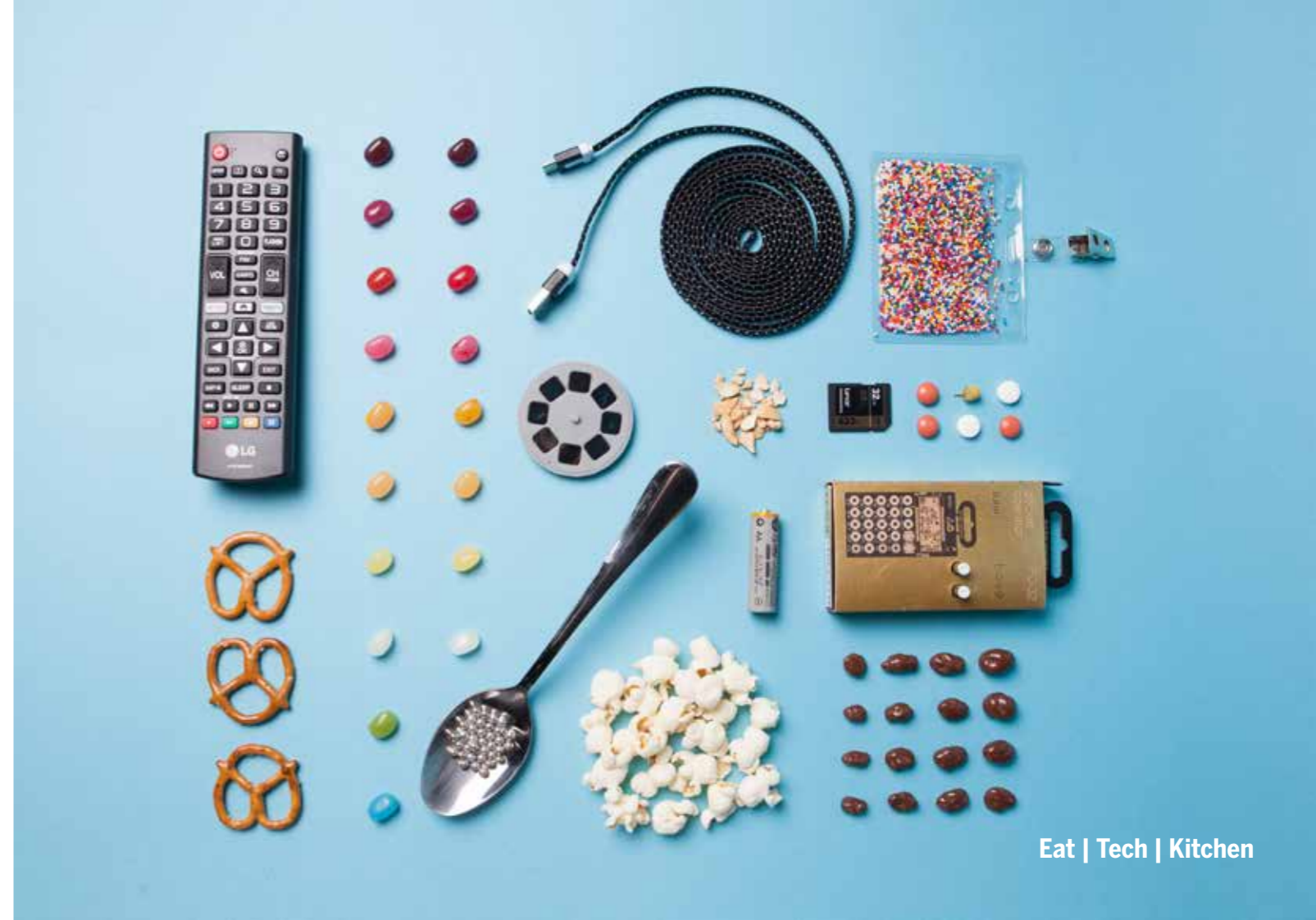
Eat | Tech | Kitchen