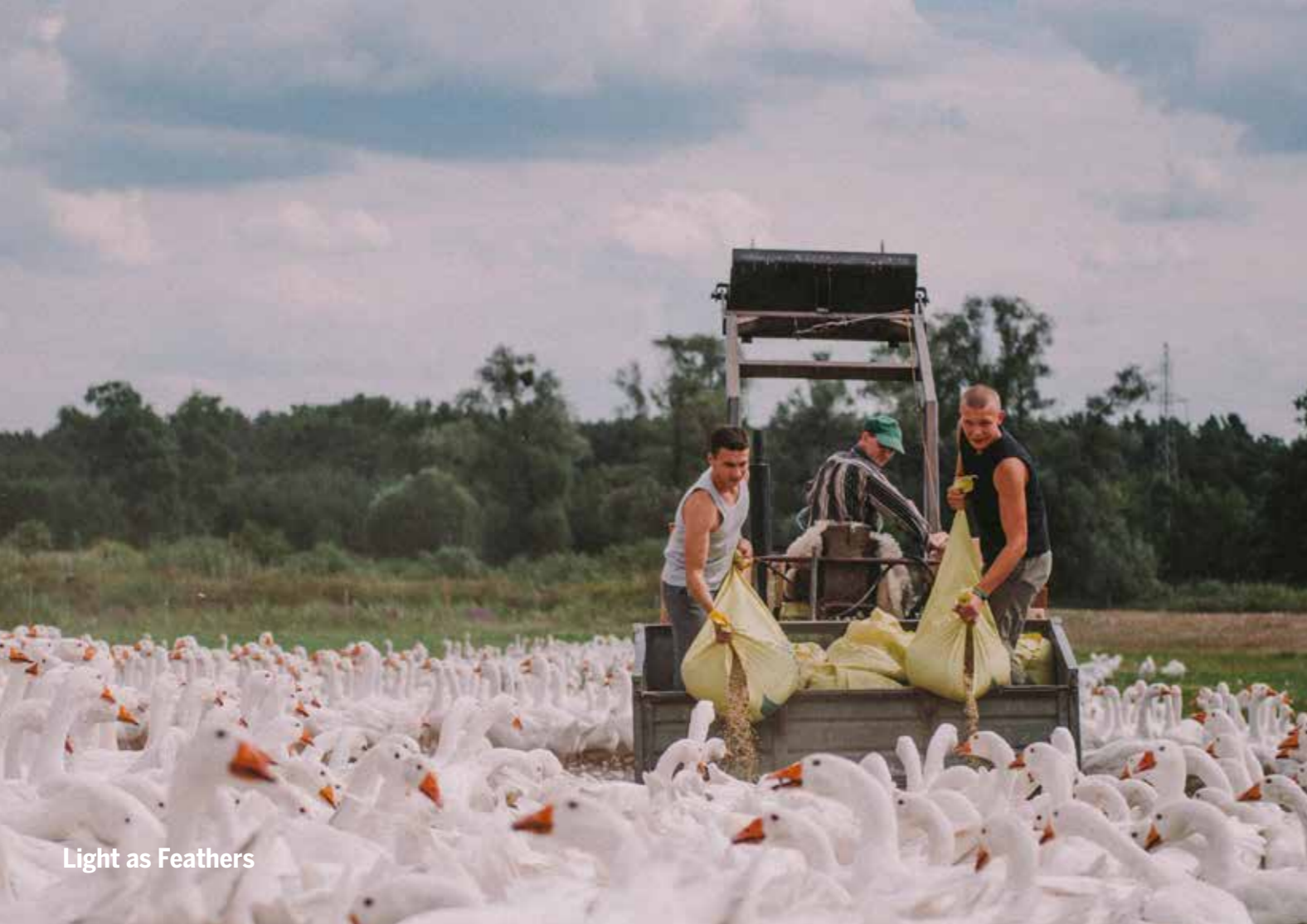
Light as Feathers