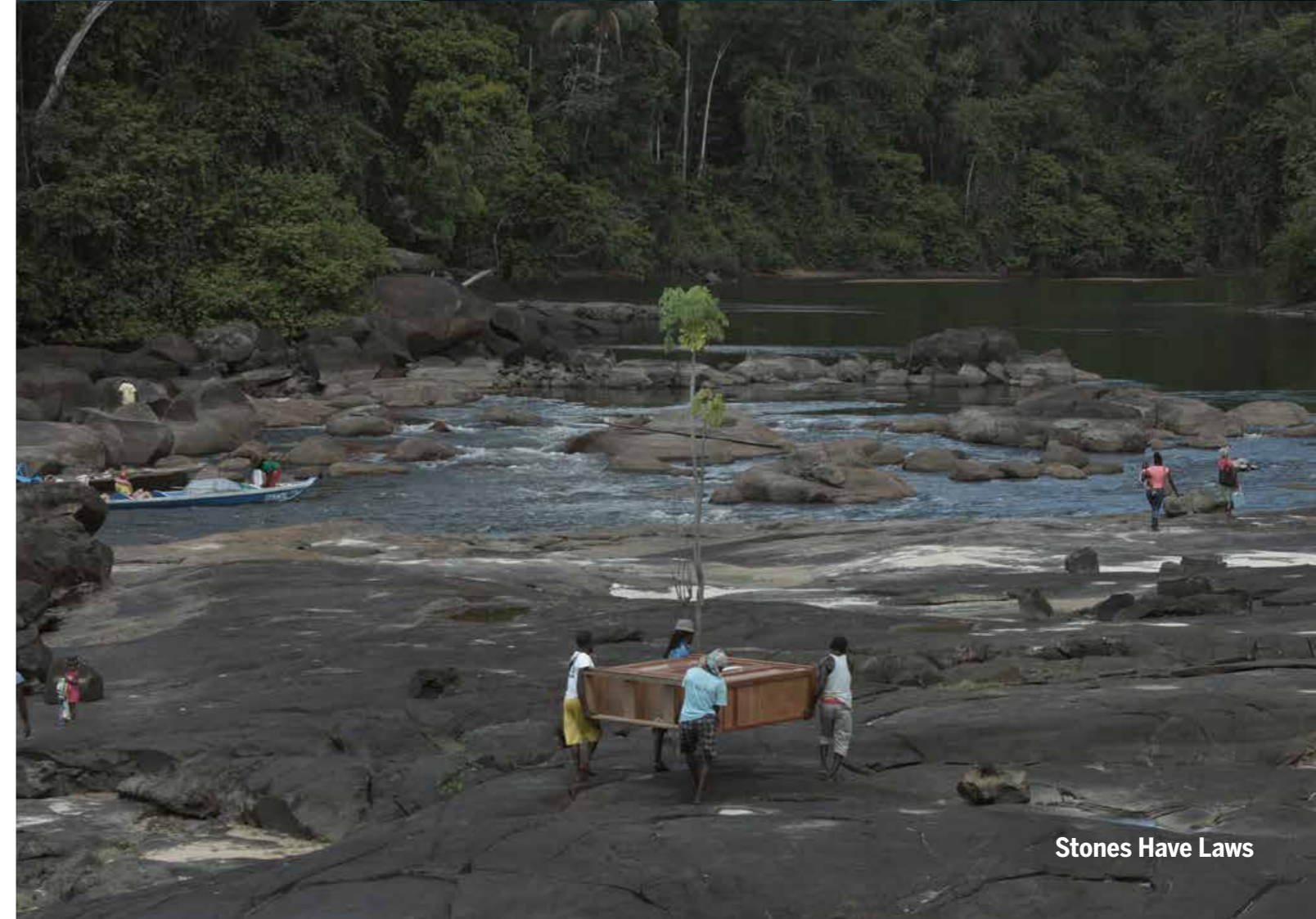
Stones Have Laws