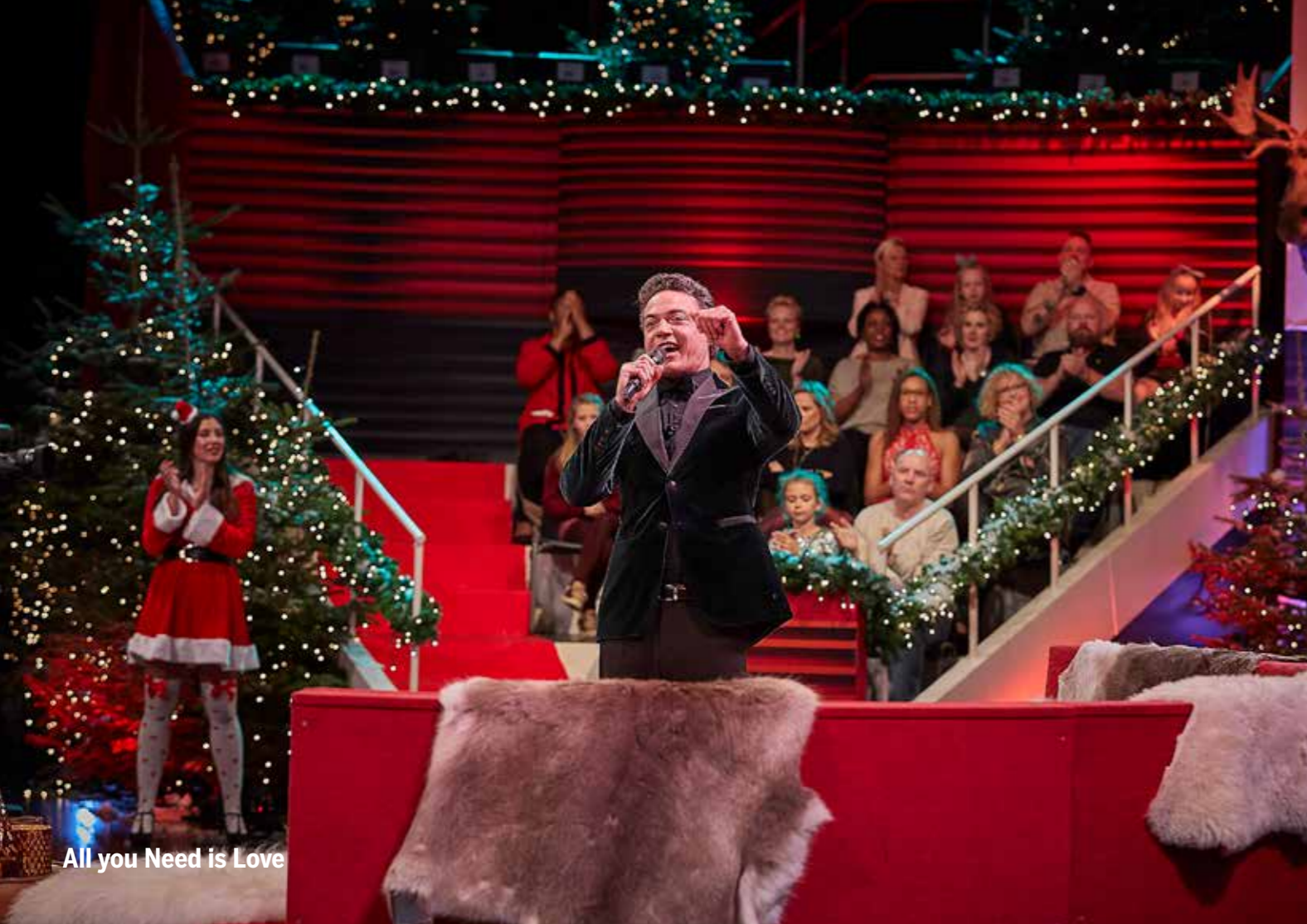
All you Need is Love