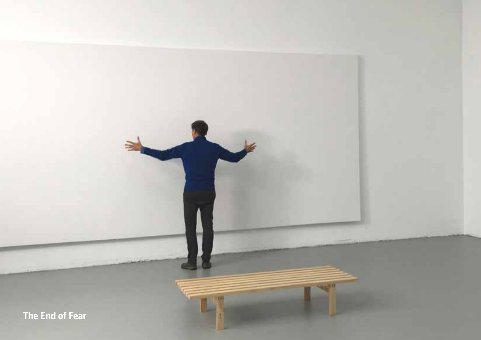
The End of Fear