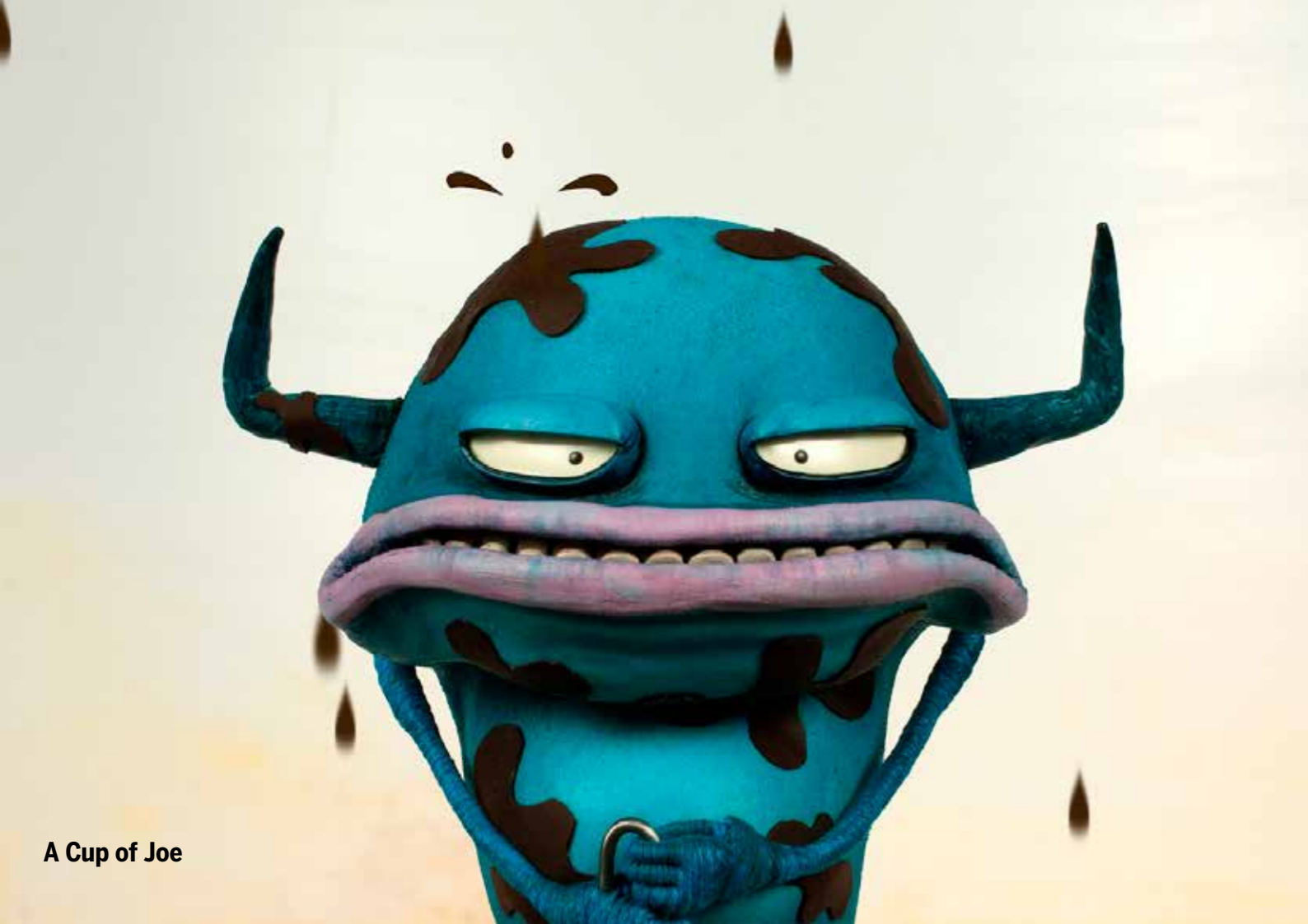
A Cup of Joe