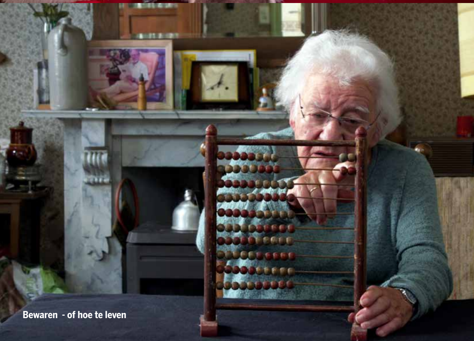
Bewaren - of hoe te leven